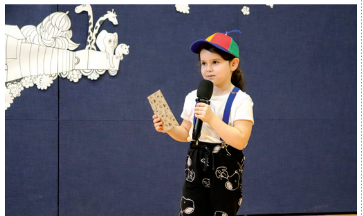
Zdjęcia SP w Wólce Rokickiej

Atmosfera konkursu na długo pozostanie w pamięci uczestników i gości, a jubileuszowa edycja udowodniła, że twórczość Juliana Tuwima wciąż inspirowa najmłodszych i zachęca do artystycznych poszukiwań.