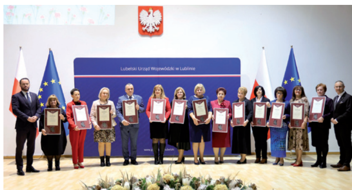
Lubelski Urząd Wojewódzkii Lublinie/Urząd Gminy Lubartów

Za jej działalność Gmina Lubartów była wielokrotnie wyróżniana w konkursie „ Gmina przyjazna Seniorom ”, co potwierdza znaczenie i skuteczność podejmowanych działań.