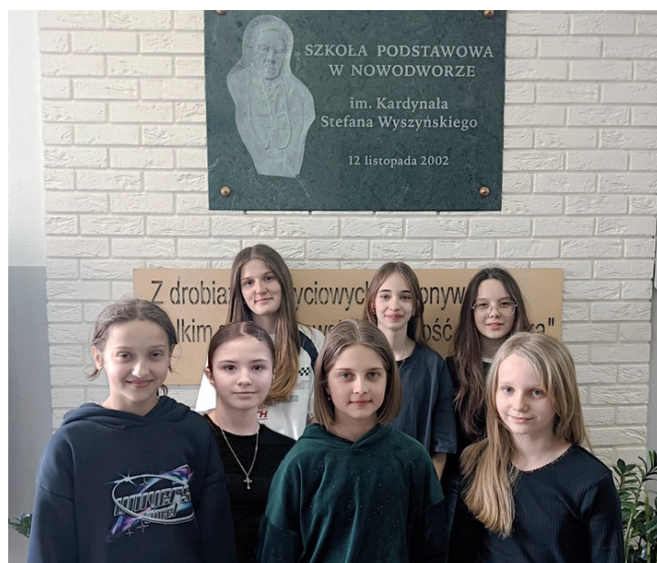
Stypendia za wyniki w nauce w I semestrze roku szkolnego 2024/2025

Po I semestrze roku szkolnego 2024/2025 przyznano uczniom 63 stypendia za wyniki w nauce oraz 32 stypendia za osiągnięcia sportowe.